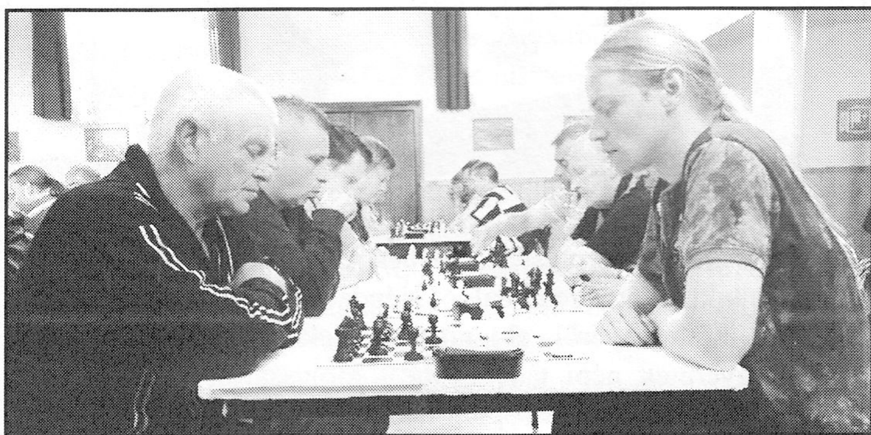
Munkában a játékosok

Június 23-án (szombaton) nyolc négyfős csapat részvételével nemzetközi rapid sakkversenyre került sor a szlovákgyarmati művelődési házban. A 2 X 15 perces játékidőjű játszmákban a versenyzők a „POLGÁRMESTER ASSZONY“ kupájáért küzdöttek, melyet - a nevéhez híven - Árvay Denisa, a település polgármestere ajánlott fel a tornára. Az indulók között találhattuk Szlovákiából Csáb, Ipolynyék, Detva, Selmecebánya és Korpona csapatait, Magyarországról pedig a Balassagyarmati Kábel SE (a torna rendezője), a Balassagyarmati Művelődési Ház, és Pásztó csapata képviseltette magát. A polgármester asszony köszöntő szavai után elindultak a sakkórák, és megkezdődött a körmérkőzéses küzdelem.